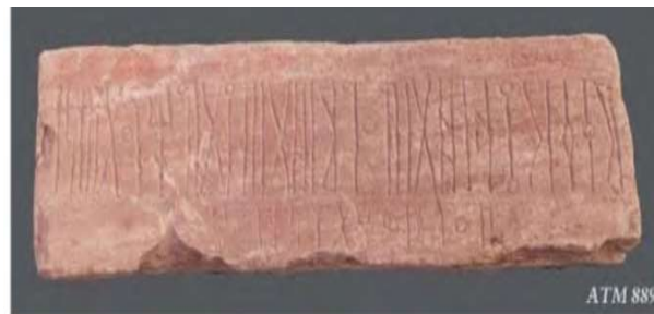
صورة رقم 4، للنقش 889، عربش؛ وباطايغ؛ والزبيدي: نقوش قتبانية، ص 101