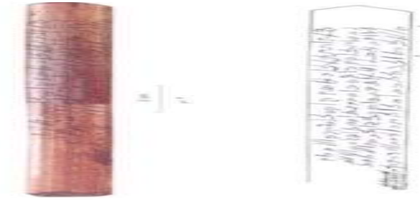
صورة 2، نقش زبوري يم 11743، عبدالله، يوسف محمد وآخرون: نقوش خشبية قديمة من اليمن، ص 98